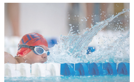
Auch die Athleten von Special Olympics zeigten im 25-Meter-Becken im Eschner Hallenbad, was sie so drauf haben.